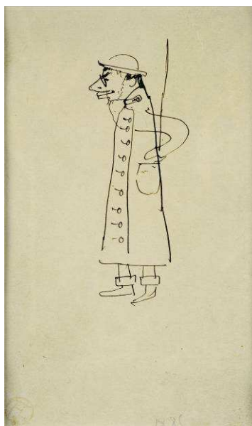
Autoportrait à charge, 1885