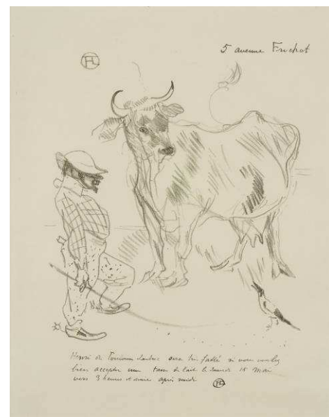
Invitation à une tasse de lait, 1897