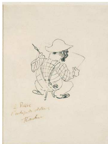
Autoportrait à charge, 1896