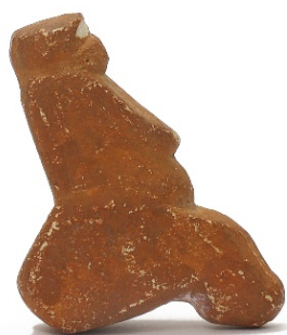
Vénus du Courbet Entre 13 000 et 15 000 ans avant Jésus-Christ Grès rouge Découverte en 1986 dans la grotte du Courbet (Penne, Tarn) Albi, Musée Toulouse-Lautrec Don d'Edmée Ladier