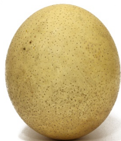
Œuf d'autruche Albi, musée Toulouse-Lautrec Don de M. Lacroix