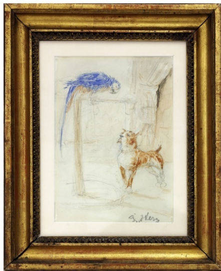
Henri de Toulouse-Lautrec (1864-1901) Perroquet et chien ; au verso Homme 1899 Aquarelle sur papier Signé « A Stern HtLautrec » au crayon en bas à droite