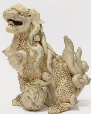
Chien de Fô Chine Non daté Porcelaine glaçurée Albi, musée Toulouse-Lautrec Legs d'Henri Imart-Rachou, 1969