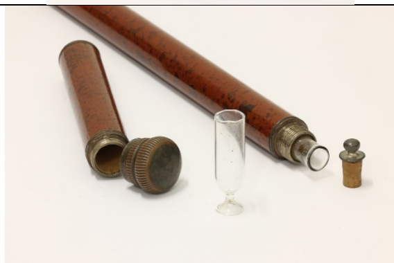
Canne attribuée à Henri de Toulouse-Lautrec Vers 1899