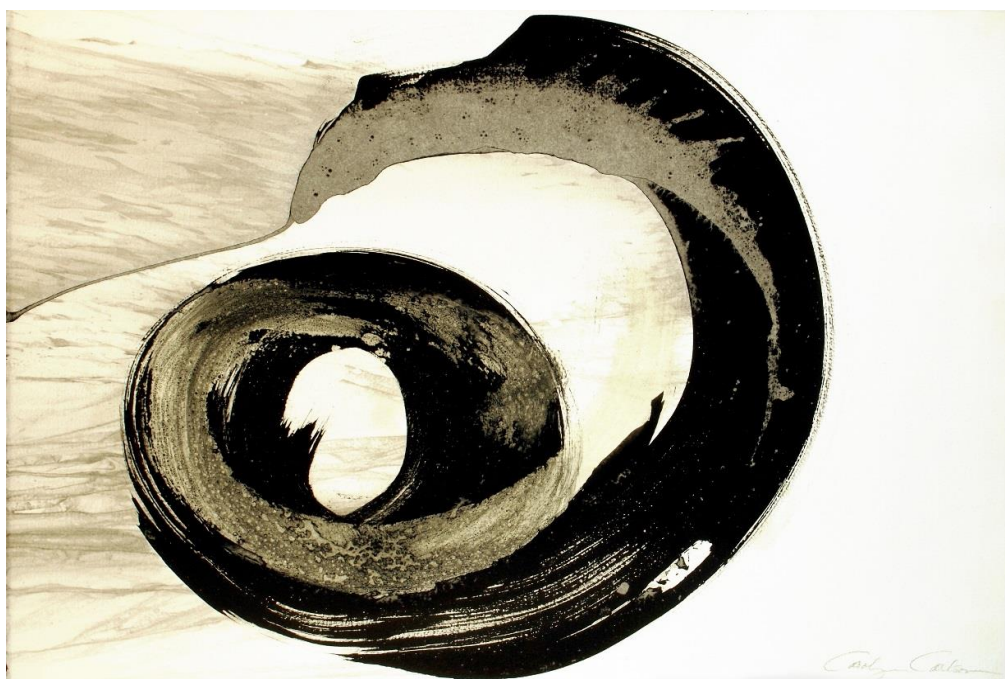
Carolyn Carlson, Sans titre

En partenariat avec le Musée la Piscine de Roubaix et la Carolyn Carlson Company