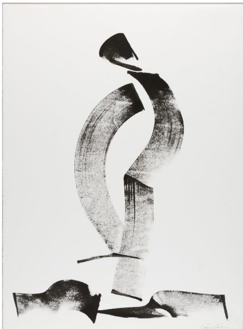
4. Carolyn Carlson, L'Homme qui marche © Alain Leprince