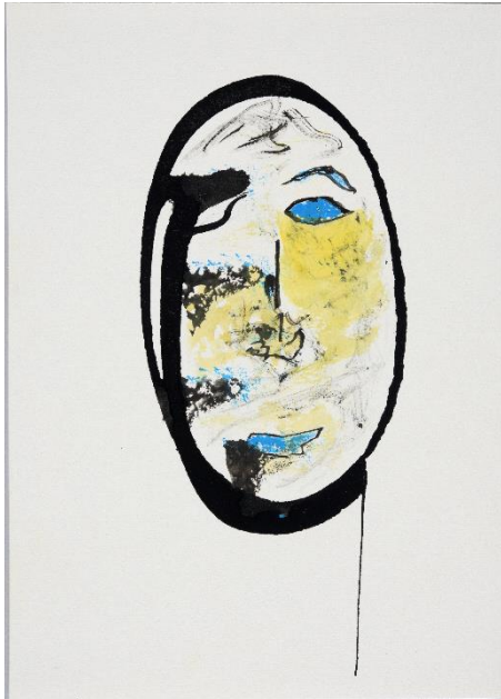
7. Carolyn Carlson, Visage