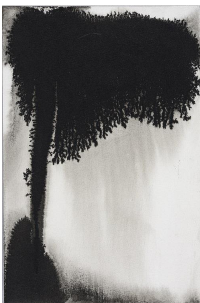
6. Carolyn Carlson, Forêt des Songes