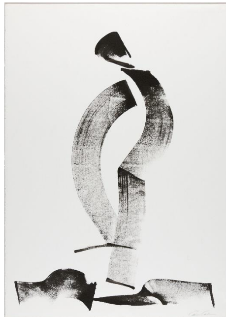
Carolyn Carlson, L'Homme qui marche