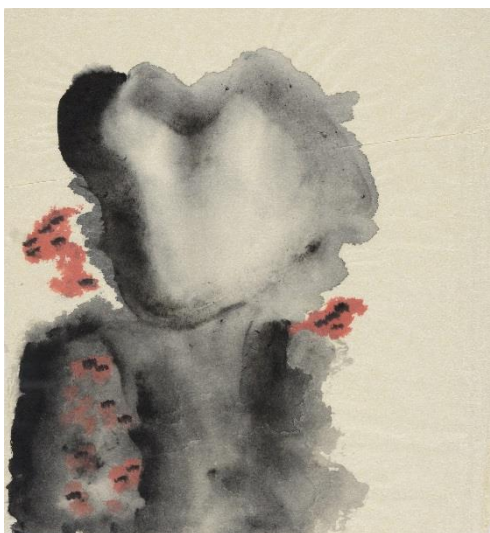
5. Carolyn Carlson, Hommage à Pina